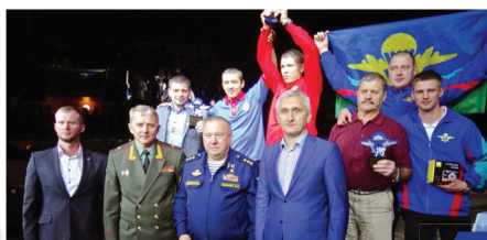
Открытие турнира в Барнауле