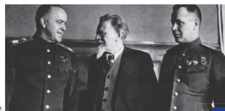
Крылатый Маршал Победы