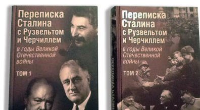
Научный успех учёных-историков