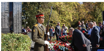
Торжества и уроки мужества